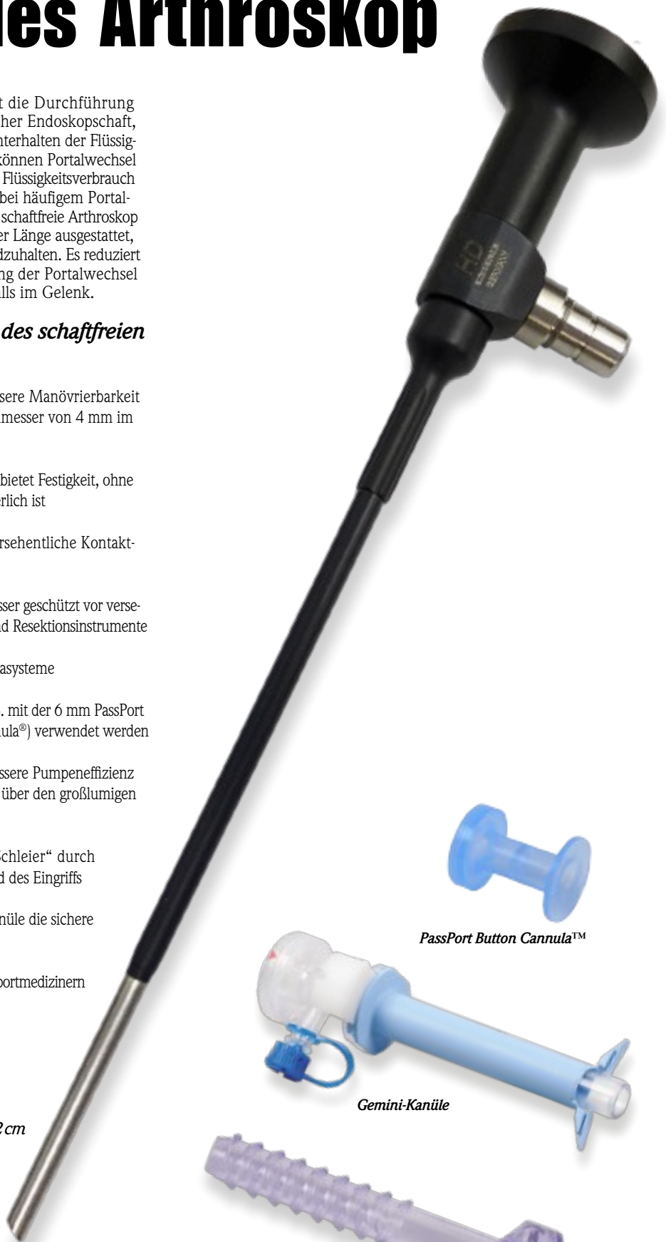
PassPort Button Cannula™